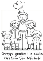
Gruppo genitori in cucina Oratorio San Michele